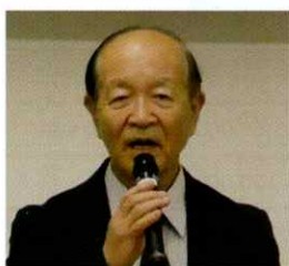
菅町会 濃沼会長挨拶