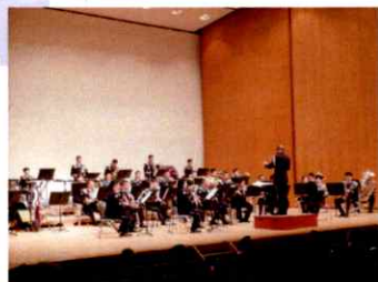
大ホールでの イベントの様子 (令和6年度)