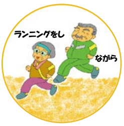
ランニングをし ながら