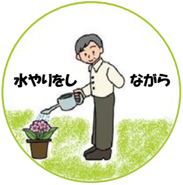
水やりをし ながら

登下校児童を見守る「ながら見守り」活動が注目されています。皆さんも御協力をお願いします!