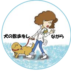
犬の散歩し ながら