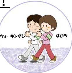
ウォーキングし ながら