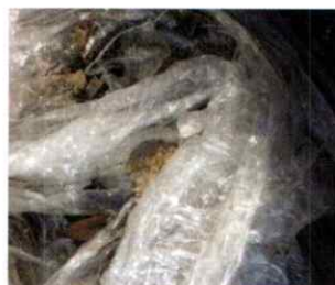
▲ 水の溜まったビニール