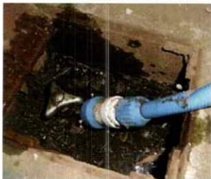
▲ 水の溜まった埋設型散水栓