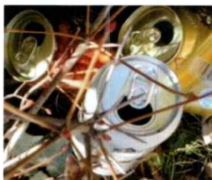
▲ 放置された空き缶