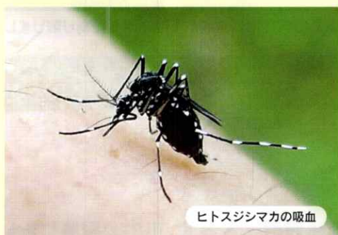
ヒトスジシマカの吸血