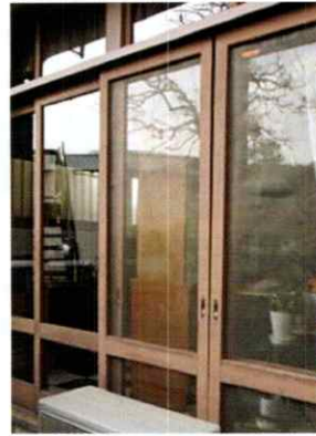
▲ 窓の開口部には網戸を!