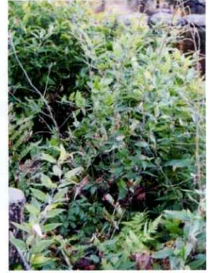
▲ やぶは刈り取りましょう