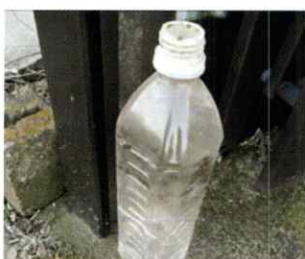
▲ 放置されたペットボトル