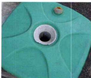
▲ 旗立て 支柱立て