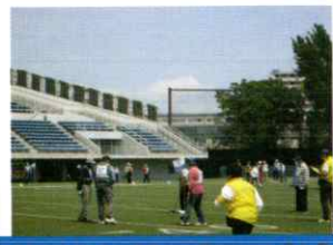
グラウンド・ゴルフ大会