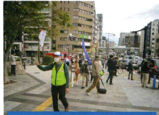
健康ウォーキング