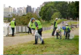
多摩川クリーン活動