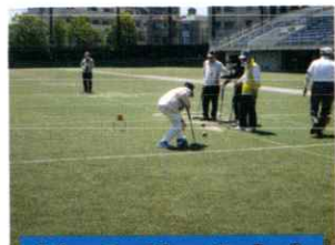
ゲートボール大会