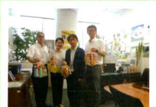
交通安全啓発折鶴贈呈