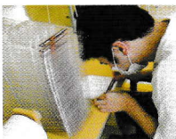
製品ラベルの貼付

コロナ感染を防ぐため、三つのグループに分かれて視察しました。様々な作業スペースがあり利用者の皆様に合わせた仕事をされていて、とても勉強になる研修でした。