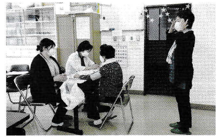
包括支援センタースタッフによる健康チェック