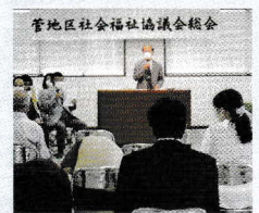
濃沼菅町会会長挨拶