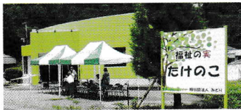
「福祉の実 たけのこ」全景