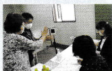
受付では手指消毒と体温測定