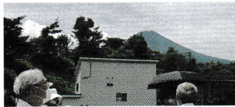
屋上から見た夏の富士山